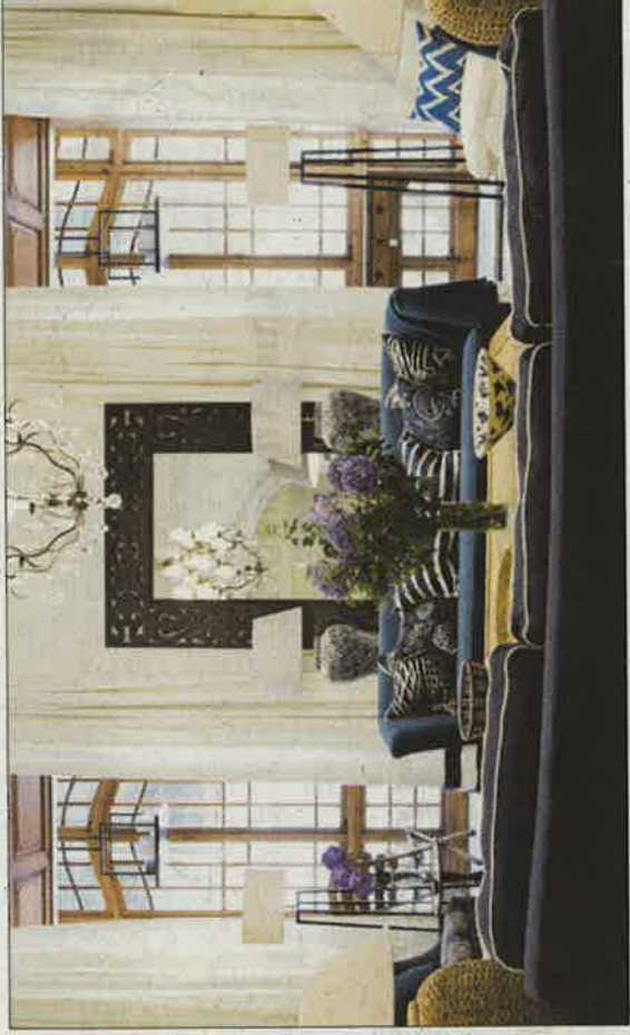
El mobiliario es de una gran elegancia.