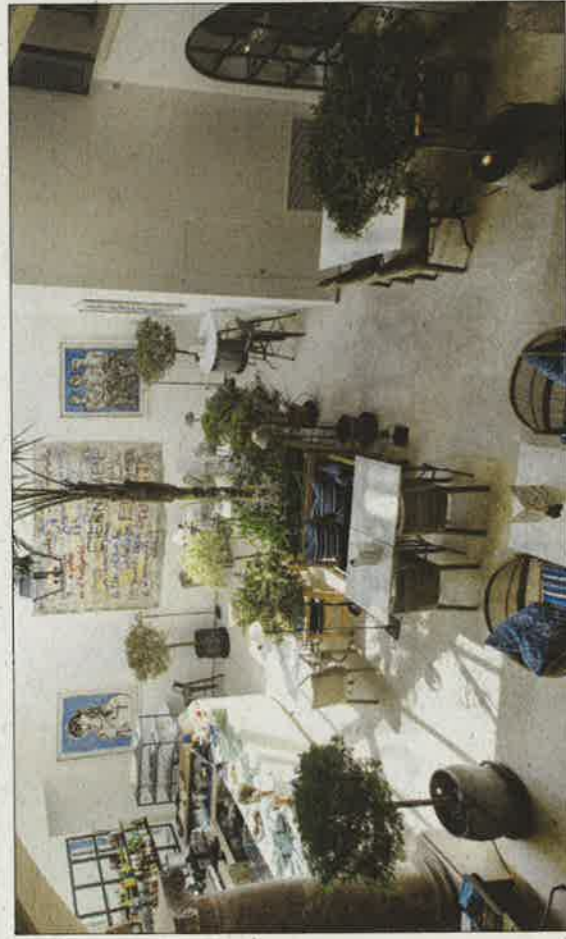
La cafetería es uno de los nuevos espacios abiertos al público.