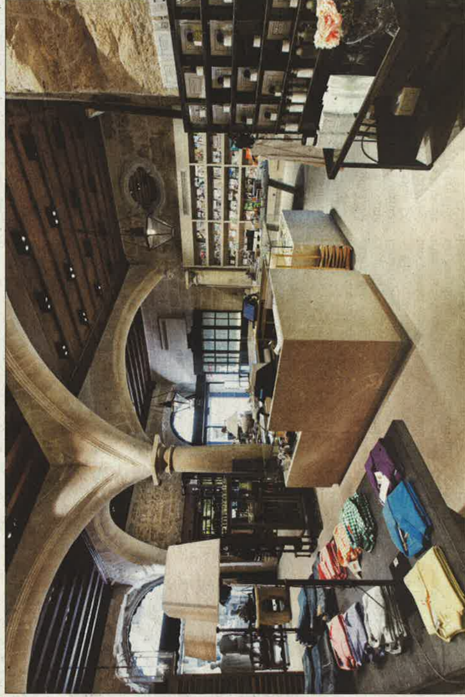
Los arcos rebajados, que solían estar en los patios, ennoblecen una de las grandes salas de Rialto Living.