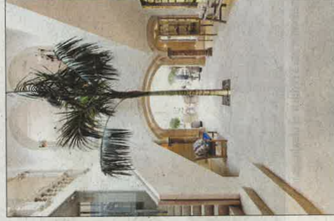
Salón neoárabe del antiguo casino.

Para lograrlo fue fundamental la comunión entre el estilo de Sergi Bastidas y Rialto Living. Elegancia informal, alta calidad en los acabados, funcionalidad, clasicismo, auténtico. Se ve en los muros de marés recuperados en habitaciones palaciegas, en las carpinterías de madera tradicionales recuperando las existentes y reproduciéndolas donde se colocan nuevas dotándolas de cris-