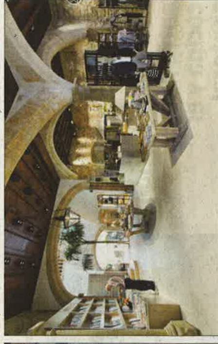
El mobiliario encaja a la perfección con el carácter de la antigua casa señorial de la calle de Sant Felú.

rroco rescatado, estaba totalmente oculto, a punto de desaparecer por hundimiento y es de los pocos que quedan en la ciudad, de los representativos del estilo de las casas nobles mallorquinas. Se descubrieron las arquerías al derribar el muro que separaba los dos locales y las columnas enterradas se devolvieron a su posición original. Hoy el espacio es majestuoso, pero también elegante y funcional. Hay que recordar que fue sede