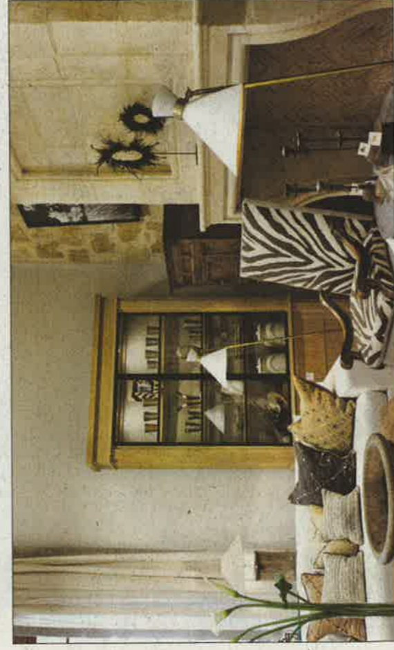
Los productos que se ofrecen han sido diseñados por grandes creadores.