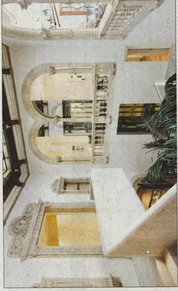
Escalera de acceso a la planta noble.

cerlo por una casa señorial mallorquina, con todos sus elementos, pero también es pasear un espacio comercial. Destriparlo es descubrir, tan muros casi milenarios la tecnología más puntera, casi ciencia ficción. Para que dure al menos otros cien años, apunta Bárbara. Se decidió recuperar el edificio a sus años de esplendor haciéndolo al mismo tiempo funcional para su nuevo uso.