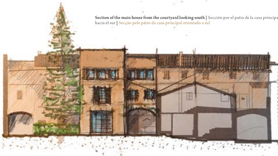
Section of the main house from the courtyard looking south | Sección por el patio de la casa principal hacia el sur | Secção pelo pátio da casa principal orientado a sul

Durante o desenvolvimento de todas estas tarefas, contruiu-se uma sólida relação de trabalho com a autarquia local, da que se recebeu apoio em todo o momento. A autarquia não só reconheceu que este era um projeto importante para Santanyí, como também partilhava a ideia de que Can Ferrereta devia ser restaurada com muito cuidado e respeito para assim manter a identidade original do edifício.