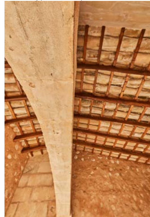
Traditional ceilings | Techos tradicionales | 1,2: Tetos tradicionais (Nando Esteva)

Na primeira fase, na que se realizaram as tarefas de construção, desmontaram-se todos os elementos estruturais da casa exceto as paredes principais e recuperaram-se as vigas existentes. Posteriormente, restauraram-se as paredes e recolocaram-se as vigas de madeira originais. Nestas últimas, manteve-se a sua cor natural, em