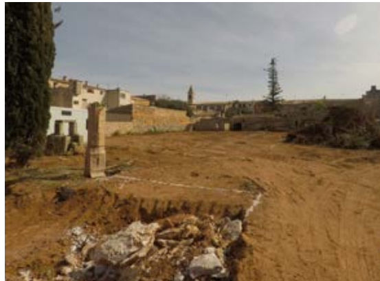
Previous state of the plot and staking out at the start of building work | Estado previo de la parcela y replanteos al comienzo de las obras | Estado previo da parcela e traçados no início das obras