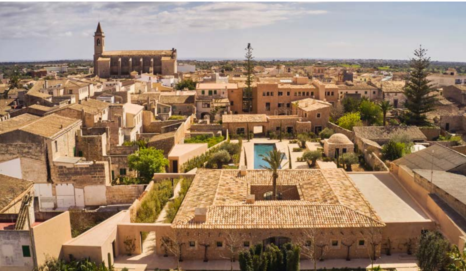
Can Ferrereta from the north | Vista de Can Ferrereta desde el norte | Vista de Can Ferrereta a norte (Nando Esteva)

Graças ao uso de materiais naturais, construiu-se um edifício plenamente integrado na arquitetura local, que mantém a essência da arquitetura tradicional desta zona do Mediterrâneo. Em todo o momento trabalhou-se com a transmitir seguinte ideia: “terminar o serviço sem que se percebam que metemos mãos à obra”.