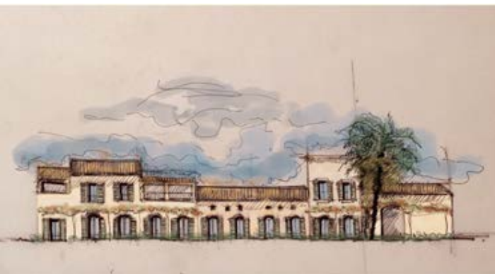
North facade of the ensemble | Fachada norte del conjunto | Fachada norte do conjunto