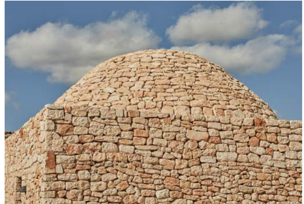
New barraca de roter | Nueva barraca de roter | Nova barraca de roter (Nando Esteva)

Integrating the pool, gardens and terraces into the built ensemble was also quite a challenge. The building between the main restored house and the newly built structure contains the spa, gym, changing rooms, equipment room and kitchen and is inspired by traditional sheep sheds known as estadors , originally designed for these animals.