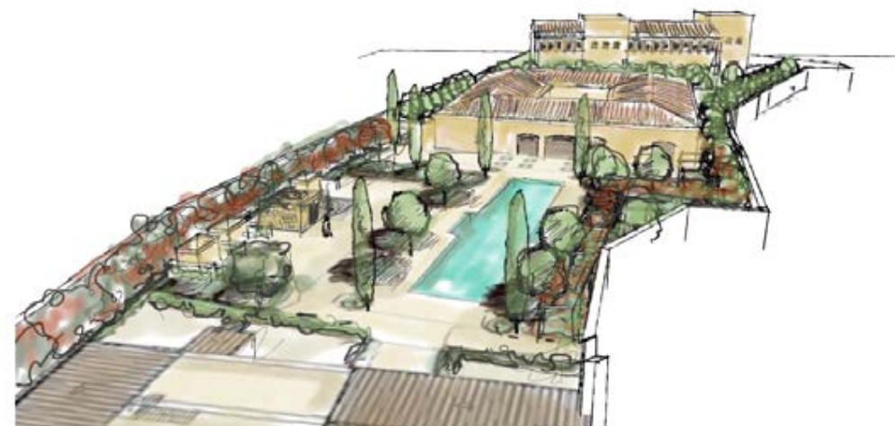
Overview | Vista del conjunto | Vista do conjunto

Aquando da conceção do projeto foi importante transmitir que a sombra pode ser ainda mais importante que luz, pois contribui para a criação de atmosferas e espaços mais aconchegadores. Igualmente importante para o projeto eram as transições de um espaço ao outro, já que o edifício devia poder descobrir-se pouco a pouco, evitando as vistas gerais.