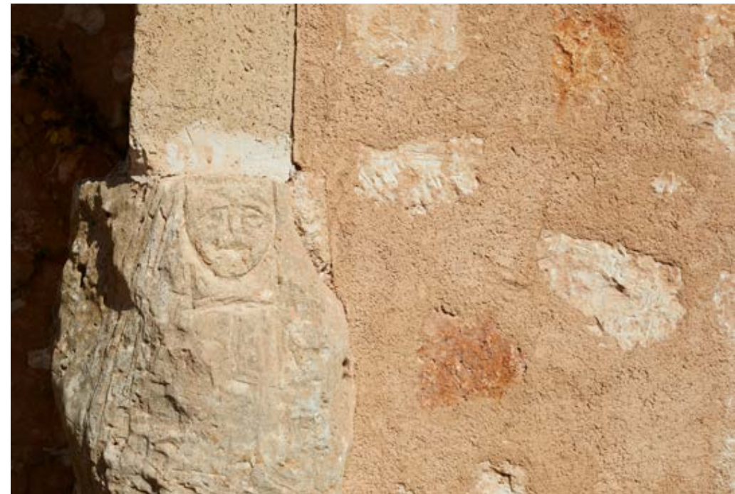
Detail of carved stonework | Detalle de una pieza de cantería labrada | Pormenor de uma peça de cantaria lavrada (Nando Esteva)

Um aspeto chave do edifício encontra-se nos materiais empregados, os típicos da zona, que já tinham sido utilizados na construção original, incluindo a distintiva pedra arenisca de Santanyí e a pintura de cal.