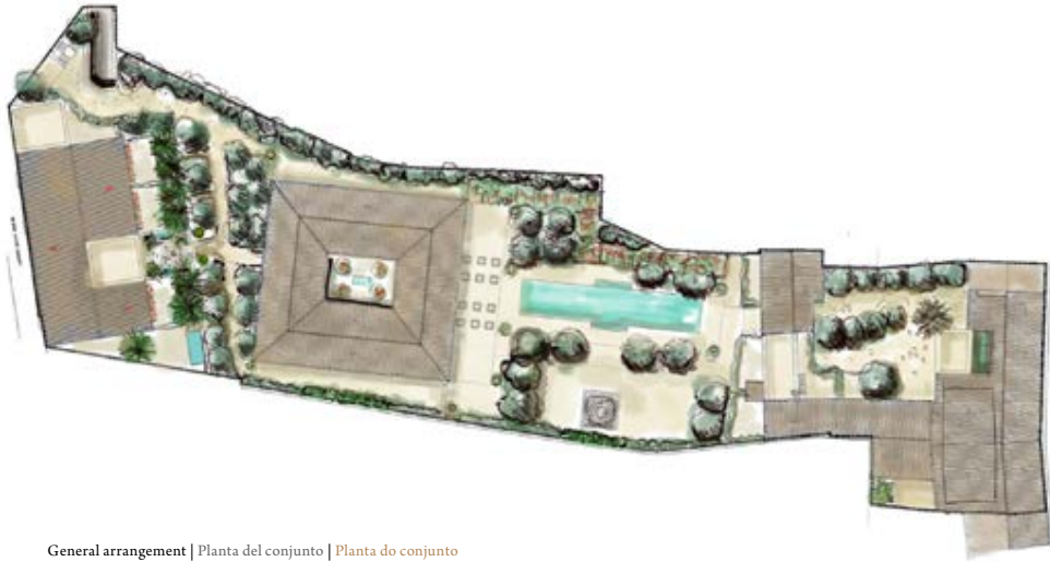
General arrangement | Planta del conjunto | Planta do conjunto